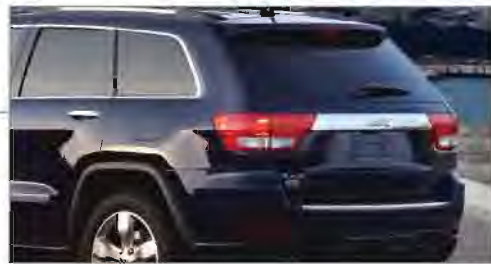
Nueva Compuerta Eléctrica

El quemacocos panorámico Dual CommandView® está compuesto por dos paneles de cristal: el delantero, sobre la primera fila, puede ser abierto y cerrado de un solo toque, mientras que el panel trasero es fijo permitiendo a los pasajeros tener una mejor vista. Disponible en las versiones Limited y Overland.