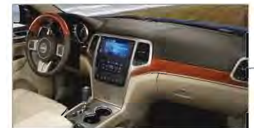
Interiores Premium de Clase Mundial

Su sistema de Entrada Pasiva y Encendido por Botón Keyless Enter-N-Go® detecta por medio de sensores, cuando el conductor porta la llave del vehículo, permitiendo abrir la puerta con un toque de la manija, así como encender el motor.