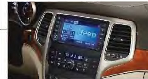
Aire Acondicionado con Control de Temperatura de 2 Zonas

Este sistema Multimedia MyGIG consta de pantalla táctil de 6.5 pulgadas, disco duro de 30GB y reproductor de CD y DVD (audio). Disponible en todas las versiones de la Grand Cherokee 2011.