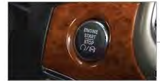
Sistema "Keyless Enter-N-Go®"

La Grand Cherokee 2011 cuenta con el nuevo sistema de audio Premium de 9 Bocinas y un Subwoofer, cuidadosamente ubicados dentro de la cabina, alimentados por un potente amplificador de 506 watts. Excepto en versión Laredo