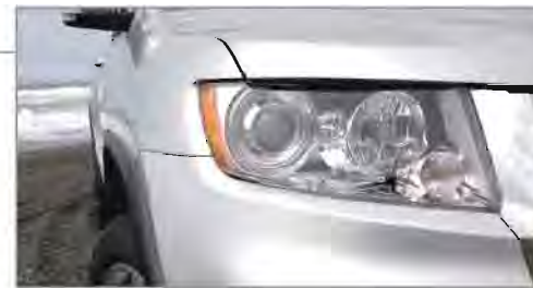
Sistema de Ajuste de Intensidad de Luces "SmartBeam®"

Este sistema ajusta automáticamente la intensidad de las luces (altas/bajas) de acuerdo a las condiciones ambientales de luz y tránsito en contraflujo. Disponible en las versiones Limited y Overland.