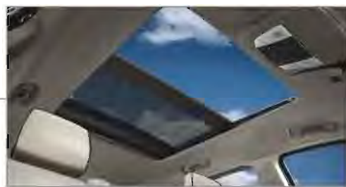
Nuevo Quemacocos Panorámico Dual "CommandView®"

El quemacocos panorámico Dual CommandView® está compuesto por dos paneles de cristal: el delantero, sobre la primera fila, puede ser abierto y cerrado de un solo toque, mientras que el panel trasero es fijo permitiendo a los pasajeros tener una mejor vista. Disponible en las versiones Limited y Overland.