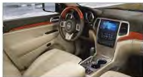
Nuevo Volante Calefactado y Asientos Delanteros Ventilados

Creamos las condiciones idóneas para que lo único que tengas en la cabeza sea relajarte gracias al nuevo soporte lumbar eléctrico de 4 vías para el conductor. Disponible en todas las versiones y también para el pasajero (excepto Laredo).