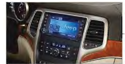
Sistema de Audio Premium

La Grand Cherokee 2011 posee A/C con control automático de temperatura de 2 zonas (control manual) en la versión Laredo.