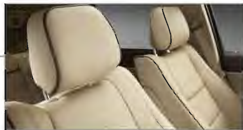
Nuevo Soporte Lumbar Eléctrico

La nueva compuerta trasera eléctrica puede ser abierta por medio de un botón, ya sea desde el interior del vehículo o bien, por medio del control remoto. Disponible en las versiones Limited Premium y Overland.